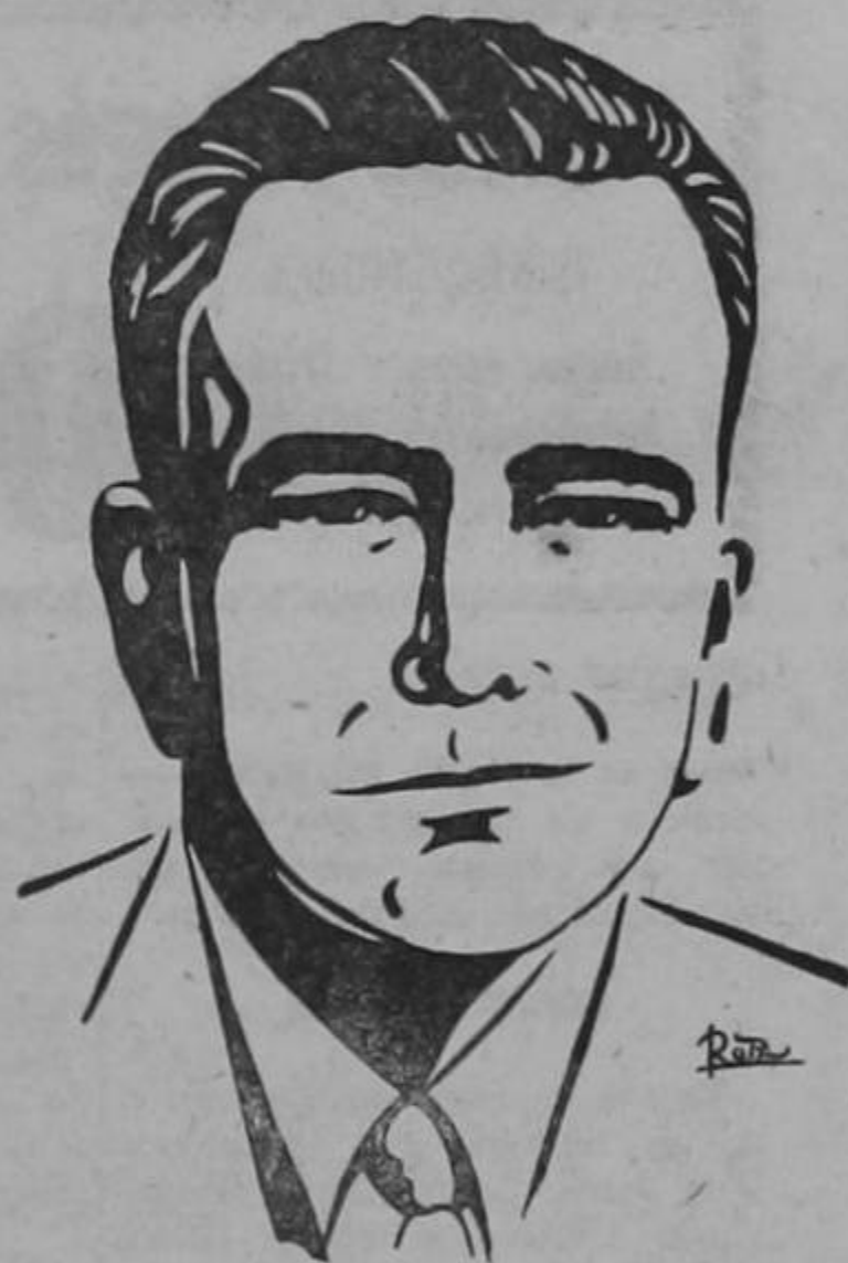
DON OTILIO ULATE

Al deberse el movimiento subversivo, se afirmó el 10% y la nacionalización de los Bancos.