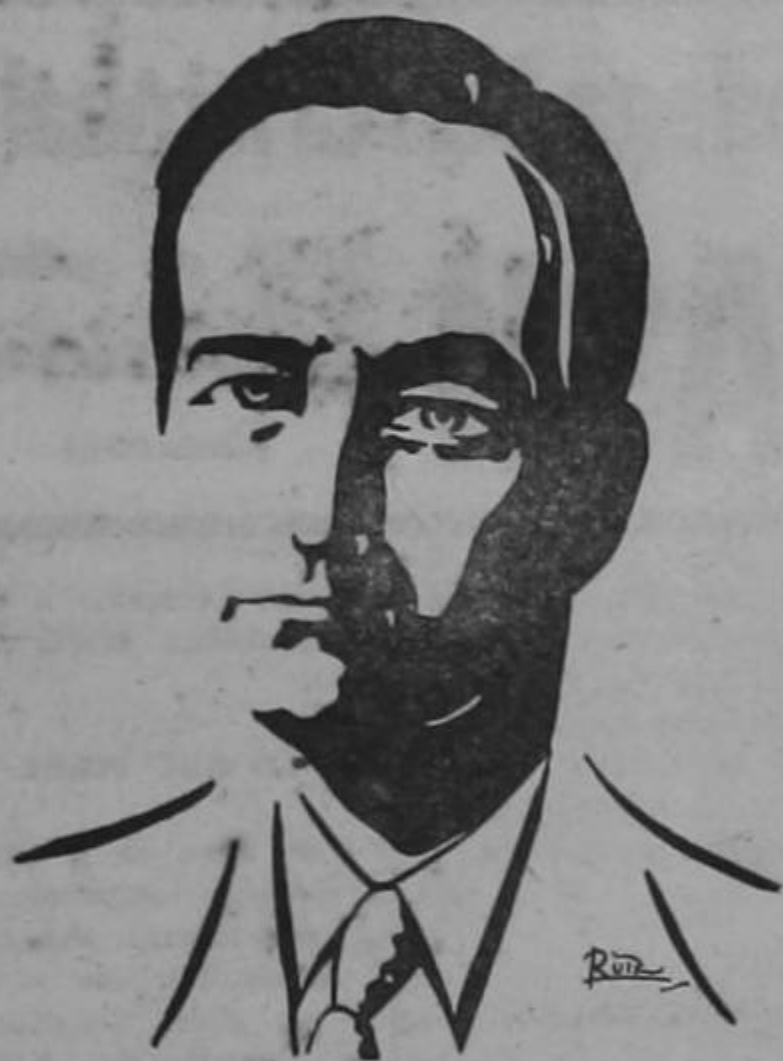
DON JOSE FIGUERES

Las causas de este lamentable golpe militarista, son bien claras. Pero cada uno —según sea su intención— ve nada más que un lado del problema. El golpe se originó por dos motivos evidentes: uno, el intento de burlar la Presidencia a don Otilio Ulate; otro, echar al suelo el impuesto del 10 por ciento y la nacionalización de los Bancos. En el primer punto tenían interés evidente los militares que traicionaron la confianza pública, en el segundo, el interés era de algunos sectores egoístas del capitalismo nacional, que no quieren resignarse a dar su aporte a la reconstrucción nacional. Nosotros, que hablamos objetivamente, —Pasa a la Pág. DOS